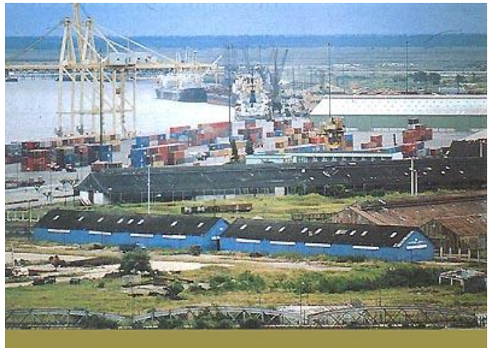
Porto di Beira in Mozambico oggi chiamato Maputo

Vi erano anche problemi con disponibilità di energia elettrica. Il paese utilizzava la corrente prodotta dall'impianto idroelettrico costruito sullo Zambesi che prende il nome di Cabora Bassa. La corrente elettrica generata era del tipo continuo, trasportata mediante linee aeree che utilizzavano cavi di alluminio e non di rame. La corrente veniva poi trasformata in alternata vicino ai punti di utilizzo. Buona parte della corrente andava al Sud Africa che aveva contribuito alla costruzione della diga. Frelimo colpiva spesso le linee di trasmissione elettrica per danneggiare il Mozambico ed il Sud Africa e per spingerli a rinunciare al possedimento coloniale. Il Mozambico divenne indipendente negli anni '70 con la caduta della dittatura in Portogallo.